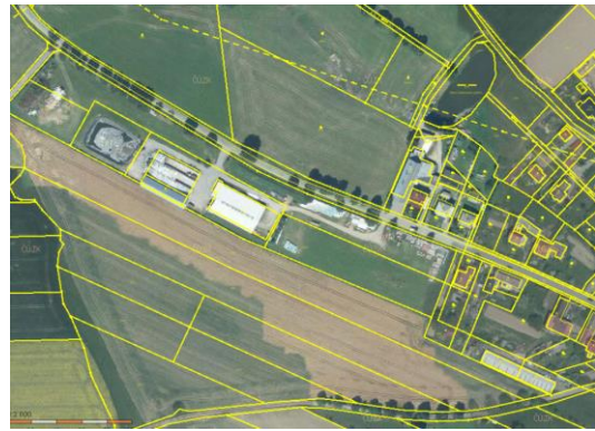
Schéma: Návrh č. 1 v ortofoto