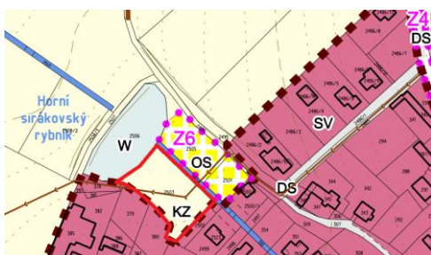
Schéma: Návrh č. 5 v územním plánu