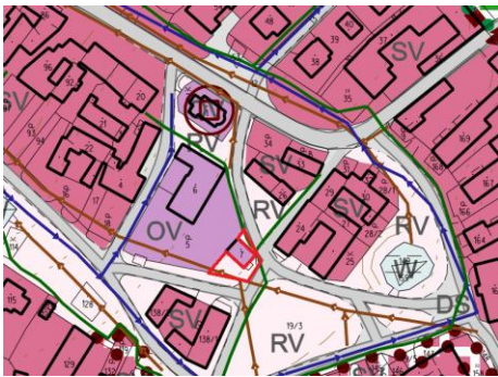
Schéma: Návrh č. 2 v územním plánu

Využití v platném ÚP – na pozemku je stávající stabilizovaná plocha „Plochy veřejného prostranství (RV)“. Pozemek se nachází v zastavěném území obce, v sousedství obecního úřadu a stávající hasičské zbrojnice. Pozemek je přístupný z veřejné komunikace. Výměra plochy je cca 200 m 2 .