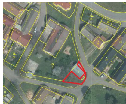
Návrh č. 2 v ortofoto