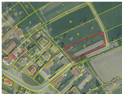
Návrh č. 3 v ortofoto