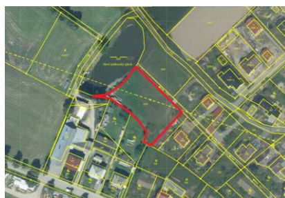
Návrh č. 5 v ortofoto